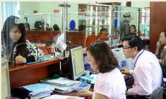
Đề xuất mới về tiêu chuẩn chức danh, chức vụ lãnh đạo, quản lý.

Bộ Nội vụ đang dự thảo Nghị định quy định tiêu chuẩn chức danh, chức vụ công chức, viên chức lãnh đạo, quản lý thuộc cơ quan hành chính nhà nước để thay thế Nghị định số 29/2024/NĐ-CP ngày 06/3/2024 của Chính phủ theo trình tự, thủ tục rút gọn.