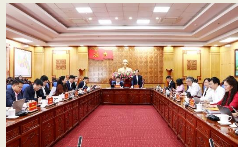
Quang cảnh buổi làm việc.