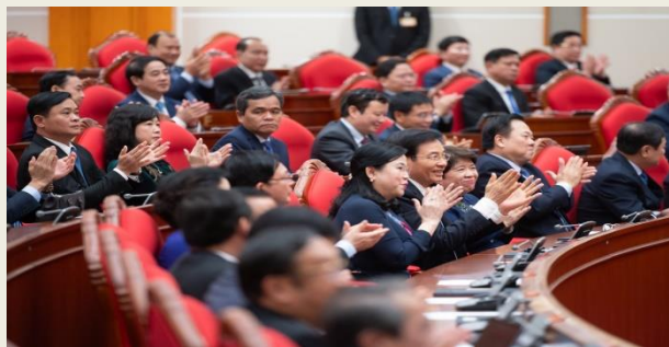
Hội nghị Trung ương 14 khóa XIII bế mạc sau 2 ngày làm việc

Trung ương Đảng giao Bộ Chính trị chỉ đạo Tiểu ban Văn kiện và các cơ quan liên quan tiếp thu ý kiến đóng góp của các tổ chức chính trị và nhân dân để hoàn thiện thêm một bước Dự thảo các văn kiện; khẩn trương, nghiêm túc tổng hợp tiếp thu, giải trình các ý kiến đóng góp để hoàn thiện các Dự thảo văn kiện trình Hội nghị Trung ương lần thứ 15 xem xét hoàn chỉnh để trình Đại hội XIV của Đảng.