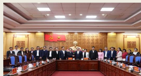
Các đại biểu chụp ảnh lưu niệm sau buổi làm việc.