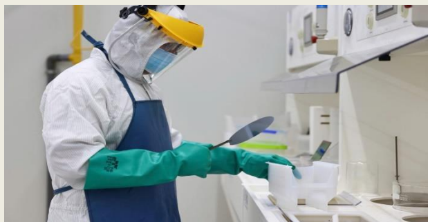
Phòng thí nghiệm bán dẫn Trung tâm nghiên cứu triển khai, Khu công nghệ cao TP HCM, tháng 12/2024.

Cán bộ được thu hút phải cam kết cống hiến, bảo đảm thời gian công tác tối thiểu tại cơ quan, đơn vị tuyển dụng. Hàng năm, họ phải báo cáo kết quả công việc, sản phẩm cụ thể.