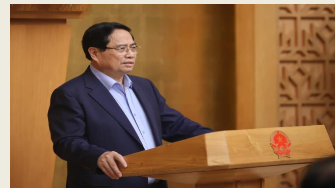
Thủ tướng Phạm Minh Chính phát biểu bế mạc phiên họp Chính phủ thường kỳ tháng 10.

Theo ông, thực tiễn cho thấy địa phương nào đạt tỷ lệ giải ngân đầu tư công cao cũng đạt tăng trưởng GRDP cao và ngược lại.