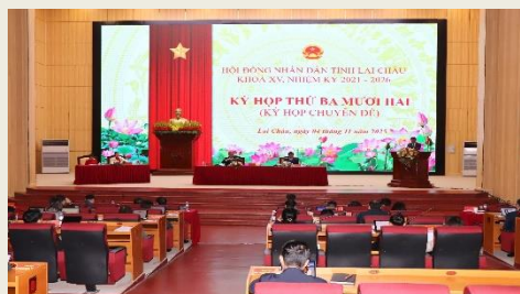
Quang cảnh kỳ họp

Tại kỳ họp đã thông qua các tờ trình đề nghị ban hành và báo cáo thẩm tra dự thảo 9 nghị quyết do UBND tỉnh trình như: Nghị quyết quy định về phân cấp nguồn thu, nhiệm vụ chi ngân sách địa phương và tỷ lệ phần trăm (%) phân chia giữa ngân sách cấp tỉnh và ngân sách cấp xã trên địa bàn tỉnh; Nghị quyết phân bổ, bổ sung kinh phí để thực hiện các chế độ, chính sách, các nhiệm vụ phát sinh và các Chương trình mục tiêu quốc gia năm 2025; Nghị quyết phân bổ chi tiết, điều chỉnh kế hoạch vốn đầu tư năm 2025 nguồn ngân sách nhà nước; Nghị quyết điều chỉnh dự toán chi ngân sách cấp tỉnh; thu, chi ngân sách các xã, phường năm 2025 được giao tại Nghị quyết số 51/NQ-HĐND ngày 23/7/2025 của HĐND tỉnh; Nghị quyết quy định một số mức chi sự nghiệp bảo vệ môi trường trên địa bàn tỉnh; Nghị quyết quy định chủ trương chuyển mục đích sử dụng rừng sang mục đích khác để thực hiện Dự án Thủy điện Nậm Ma 1A; Nghị quyết quy định chủ trương chuyển mục đích sử dụng rừng sang mục đích khác để thực hiện Dự án Thủy điện Nậm Cùm 6; Nghị quyết bãi bỏ Nghị quyết số 40/2022/NQ-HĐND ngày 20/9/2022 của HĐND tỉnh quy định chính sách khen thưởng, hỗ trợ đối với tập thể, cá nhân thực hiện tốt công tác dân số trên địa bàn tỉnh; Nghị quyết bãi bỏ Nghị quyết 43/2024/NQ-HĐND ngày 30/9/2024 của HĐND tỉnh quy định thẩm quyền quyết định việc mua sắm tài sản của các nhiệm