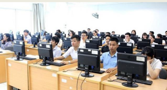
Quy chế mới về thi tuyển, xét tuyển công chức.

Quy chế thi tuyển, xét tuyển công chức mới được Bộ trưởng Bộ Nội vụ ban hành kèm theo Thông tư số 22/2025/TT-BNV, có hiệu lực thi hành từ ngày 10/12/2025, trong đó quy định rõ các cách thức tổ chức tuyển dụng công chức