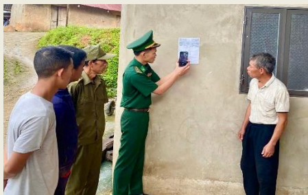
Cán bộ Đồn Biên phòng Ka Lăng hướng dẫn người dân quét mã QR trên điện thoại thông minh để sử dụng “Hòm thư tiếp nhận tin báo”

Đồn Biên phòng Ka Lăng có nhiệm vụ quản lý, bảo vệ hơn 15km đường biên giới tiếp giáp với Trung Quốc; quản lý 8 bản của xã Ka Lăng cũ, nay là xã Thu Lũm. Thực hiện chủ trương tăng cường ứng dụng công nghệ thông tin trong tuyên truyền, phổ biến pháp luật trong vùng đồng bào dân tộc thiểu số và vùng biên giới, Đồn Biên phòng Ka Lăng (Ban Chỉ huy Bộ đội Biên phòng tỉnh) đẩy mạnh phong trào “Bình dân học vụ số”.