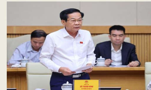
Bộ trưởng Bộ Nội vụ Đỗ Thanh Bình báo cáo tại phiên họp

Bộ trưởng Bộ Nội vụ Đỗ Thanh Bình cho biết, 34/34 tỉnh, thành phố đã và đang triển khai các phương án sắp xếp đơn vị sự nghiệp công lập; 3.321 xã, phường, đặc khu đã triển khai việc thành lập đơn vị sự nghiệp công lập ở cấp xã.