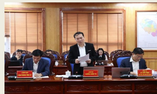
Lãnh đạo Trường Chính trị tỉnh Lai Châu báo cáo tại buổi làm việc.

Báo cáo nêu rõ, đối với công tác đào tạo, bồi dưỡng cán bộ từ năm 2020 đến nay, Ban Thường vụ Tỉnh ủy Lai Châu đã cử 468 đồng chí đi đào tạo cao cấp lý luận chính trị; đảm bảo tỷ lệ 1/1,2 giữa hệ tập trung/hệ không tập trung theo quy định.