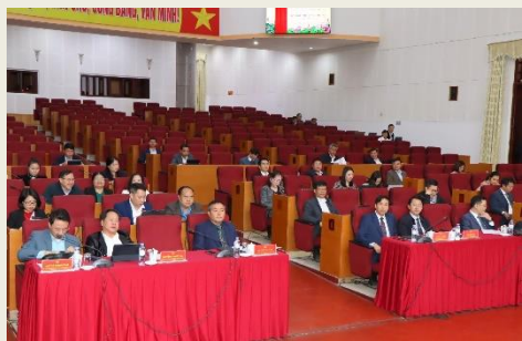
Các đại biểu dự kỳ họp.