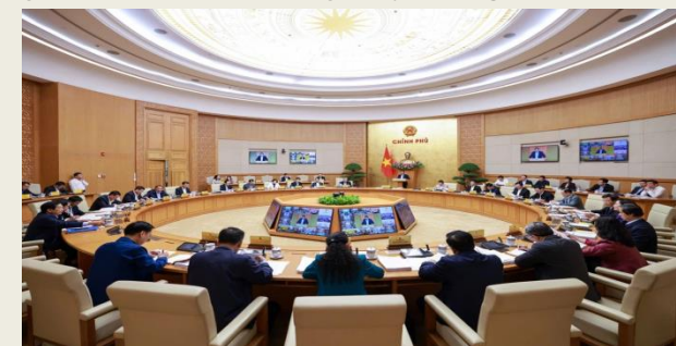
Thủ tướng Phạm Minh Chính chủ trì phiên họp Chính phủ thường kỳ tháng 10 trực tuyến với các địa phương.

Cùng với đó, ông chỉ đạo tập trung khởi công gần 100 trường phổ thông nội trú, bán trú liên cấp ở các xã biên giới; thu hồi đất sạch, giao dự án đặt hàng xây dựng nhà ở xã hội.