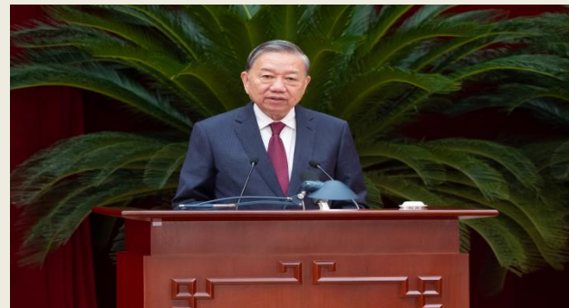
Tổng Bí thư Tô Lâm phát biểu bế mạc Hội nghị Trung ương 14 khóa XIII

Sáng 6.11, phát biểu bế mạc Hội nghị Trung ương 14 khóa XIII, Tổng Bí thư Tô Lâm nêu rõ, sau 2 ngày làm việc, Trung ương Đảng đã quyết định nhiều nội dung quan trọng. Trong đó, thống nhất số lượng nhân sự Bộ Chính trị, Ban Bí thư khóa XIV; thống nhất nhân sự giới thiệu tham gia Bộ Chính trị, Ban Bí thư khóa XIV, một số nội dung liên quan đến nhân sự cấp cao của Đảng, Nhà nước; thống nhất nội dung các vấn đề chuẩn bị tổ chức Đại hội lần thứ XIV của Đảng.