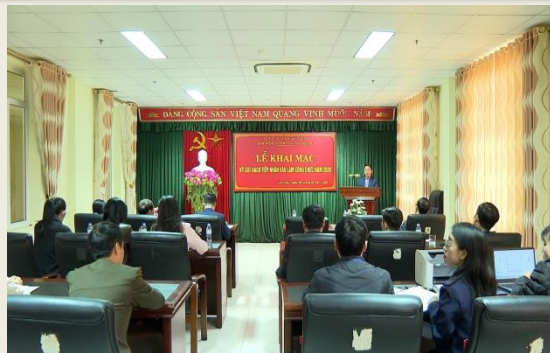
Quang cảnh khai mạc.