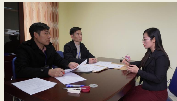
Thí sinh bước vào kỳ sát hạch tiếp nhận vào làm công chức năm 2026.