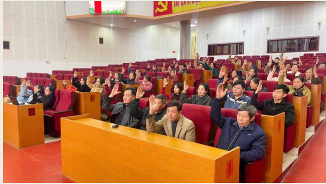
Phường Tân Phong tổ chức Hội nghị cử tri nơi công tác đối với người được dự kiến giới thiệu ứng cử đại biểu HĐND các cấp.

Ủy ban Mặt trận Tổ quốc Việt Nam tỉnh đã ban hành Kế hoạch về việc tổ chức Hội nghị hướng dẫn cơ quan, tổ chức, đơn vị được phân bổ giới thiệu người ứng cử đại biểu Quốc hội khóa XVI và đại biểu HĐND tỉnh nhiệm kỳ 2026 - 2031; tổ chức Hội nghị Hướng dẫn hồ sơ ứng cử đại biểu Quốc hội khóa XVI và đại biểu HĐND tỉnh nhiệm kỳ 2026 - 2031; hướng dẫn tổ chức Hội nghị cử tri nơi công tác, cư trú đối với người ứng cử đại biểu Quốc hội khóa XVI và đại biểu HĐND các cấp nhiệm kỳ 2026 - 2031. Hiện các cơ quan, đơn vị, địa phương đang triển khai tổ chức Hội nghị cử tri nơi công tác, cư trú để giới thiệu người ứng cử đại biểu Quốc hội, đại biểu HĐND các cấp theo quy định.