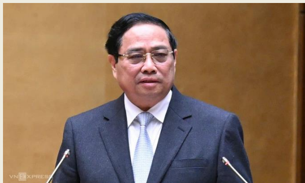
Thủ tướng Phạm Minh Chính trình bày Chương trình hành động thực hiện Nghị quyết Đại hội Đảng XIV.

Sáng 7/2, trình bày Chương trình hành động thực hiện Nghị quyết Đại hội Đảng XIV, Thủ tướng Phạm Minh Chính cho hay tinh thần xuyên suốt là "biến ý chí thành hành động, biến quyết sách thành kết quả cụ thể; nói là làm, làm ngay, làm đúng, làm quyết liệt, làm đến cùng và làm hiệu quả".