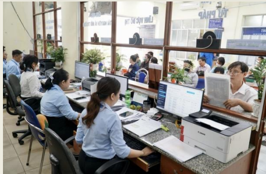
Tiếp tục hoàn thiện, nâng cao hiệu quả vận hành mô hình chính quyền địa phương 2 cấp

Rà soát văn bản, sửa đổi, bổ sung các quy định không còn phù hợp với mô hình chính quyền 02 cấp 1- Đối với các bộ, ngành trung ương