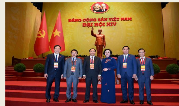
Phó Thủ tướng Chính phủ Phạm Thị Thanh Trà chụp ảnh với các đồng chí lãnh đạo chủ chốt của tỉnh Lai Châu tại Đại hội XIV của Đảng.