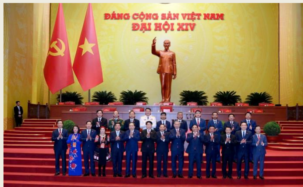
Các đồng chí lãnh đạo Đảng, nhà nước chụp ảnh lưu niệm cùng đoàn đại biểu Đảng bộ tỉnh Lai Châu tại Đại hội XIV của Đảng.

Việc tỉnh Lai Châu có cán bộ tham gia Ban Chấp hành Trung ương sẽ góp phần tăng cường tiếng nói của địa phương trong quá trình tham gia hoạch định các chủ trương, quyết sách lớn, qua đó tạo điều kiện thuận lợi để Lai Châu tranh thủ tốt hơn các nguồn lực, cơ chế, chính sách phục vụ phát triển kinh tế – xã hội, bảo đảm quốc phòng – an ninh.