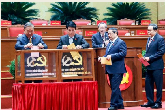
Tổng Bí thư Tô Lâm và các đồng chí lãnh đạo Đảng, Nhà nước bỏ phiếu bầu BCH Trung ương Đảng khóa XIV.