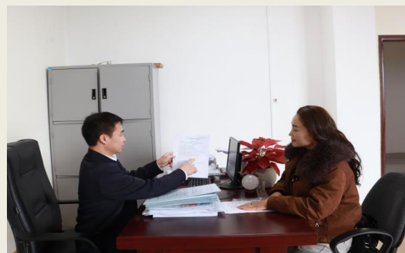
Lãnh đạo Phòng Xây dựng chính quyền và Công tác thanh niên (Sở Nội vụ) hướng dẫn người ứng cử đại biểu Quốc hội kê khai, nộp hồ sơ.