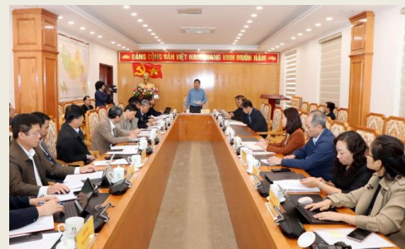
Ủy ban bầu cử tỉnh tổ chức họp triển khai công tác bầu cử đại biểu Quốc hội khóa XVI và đại biểu HĐND các cấp nhiệm kỳ 2026 - 2031.

Thực hiện Chỉ thị số 46-CT/TW của Bộ Chính trị về lãnh đạo cuộc bầu cử đại biểu Quốc hội khóa XVI và bầu cử đại biểu HĐND các cấp nhiệm kỳ 2026 - 2031, công tác lãnh đạo, chỉ đạo, tuyên truyền, quán triệt về cuộc bầu cử được cấp ủy, chính quyền các cấp trên địa bàn tỉnh tích cực triển khai thực hiện đảm bảo tiến độ, thời gian theo quy định. Ban Thường vụ Tỉnh ủy Lai Châu đã ban hành Quyết định về việc thành lập Ban Chỉ đạo cuộc bầu cử đại biểu Quốc hội khóa XVI và bầu cử đại biểu HĐND các cấp nhiệm kỳ 2026 - 2031, Ban Chấp hành Đảng bộ tỉnh đã ban hành phương hướng chuẩn bị cơ cấu, nhân sự đại biểu Quốc hội, đại biểu HĐND tỉnh nhiệm kỳ 2026 - 2031; Thường trực HĐND tỉnh ban hành Công văn dự kiến số lượng, thành phần, cơ cấu đại biểu Quốc hội khoá XVI, đại biểu HĐND tỉnh nhiệm kỳ 2026 - 2031 và dự kiến phân bổ số lượng người của cơ quan, đơn vị, địa phương ứng cử đại biểu HĐND tỉnh nhiệm kỳ 2026 - 2031.